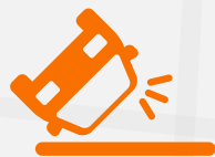
Destombamento e Içamento