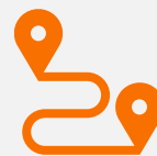
Leva ou Traz