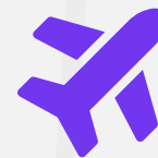
Translado de Corpo